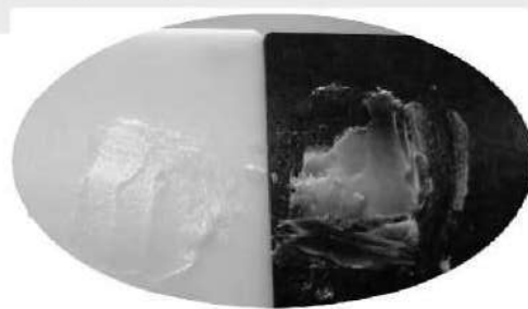
写真② 白台、黒台 混和比較