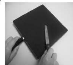
軟膏なしの状態で使用