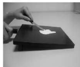
通常より、軽い力で使用する

ステンレス製ヘラは、ご使用の個人差により軟膏板に傷つく場合がございます。使われる場合は、下記ご使用方法ご確認の上、ご了承願います。