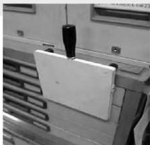
写真① 机 引っ掛け図