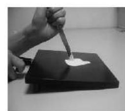
ヘラを垂直にあてる